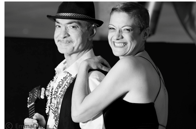
Le Duo Cabaretto

*Merci de signaler votre présence en Mairie avant le mardi 8 octobre ou de téléphoner au 06 09 15 06 62 .