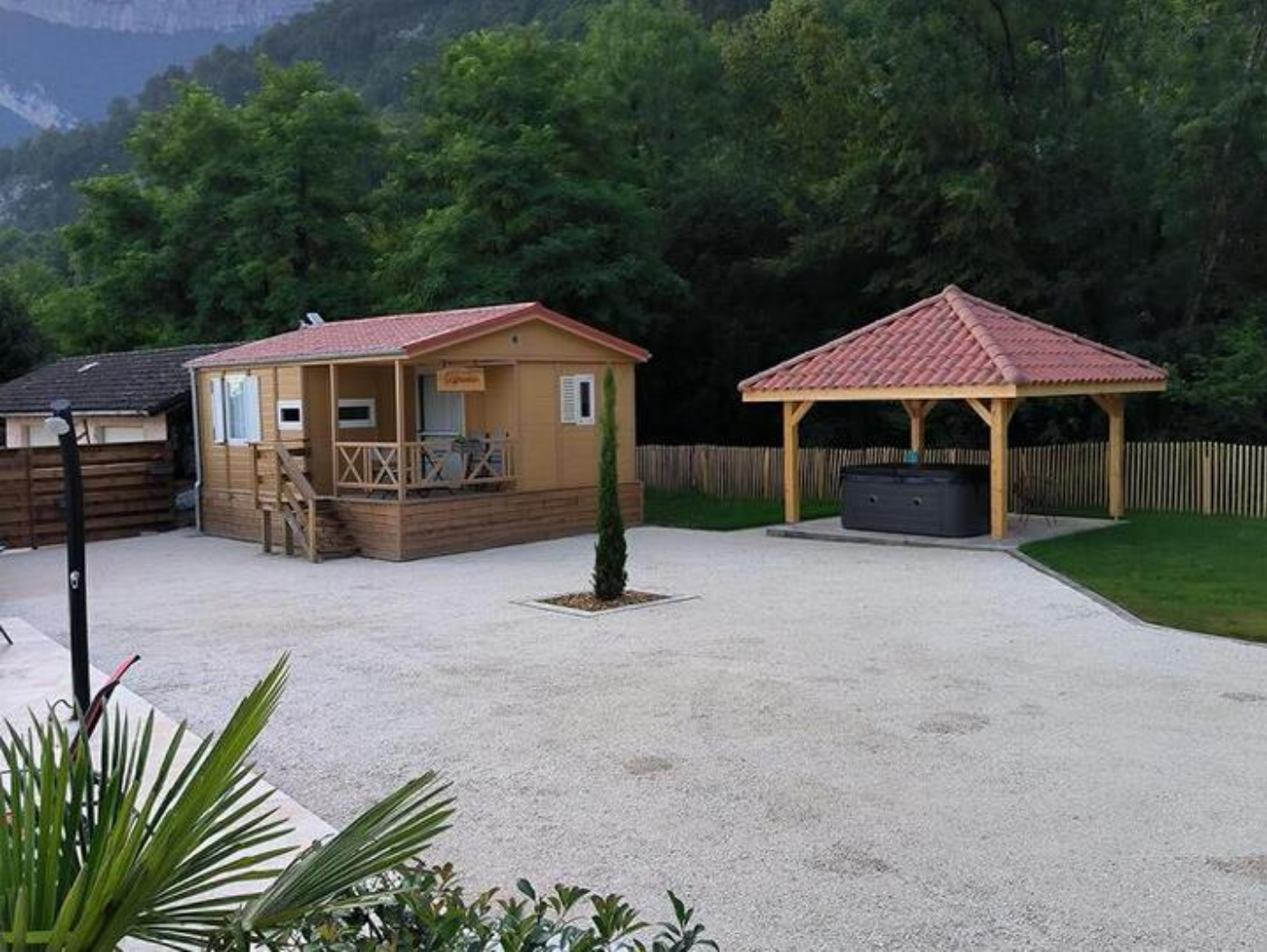
Les Chalets Rovonnais | Le Drevenne 38470 Rovon