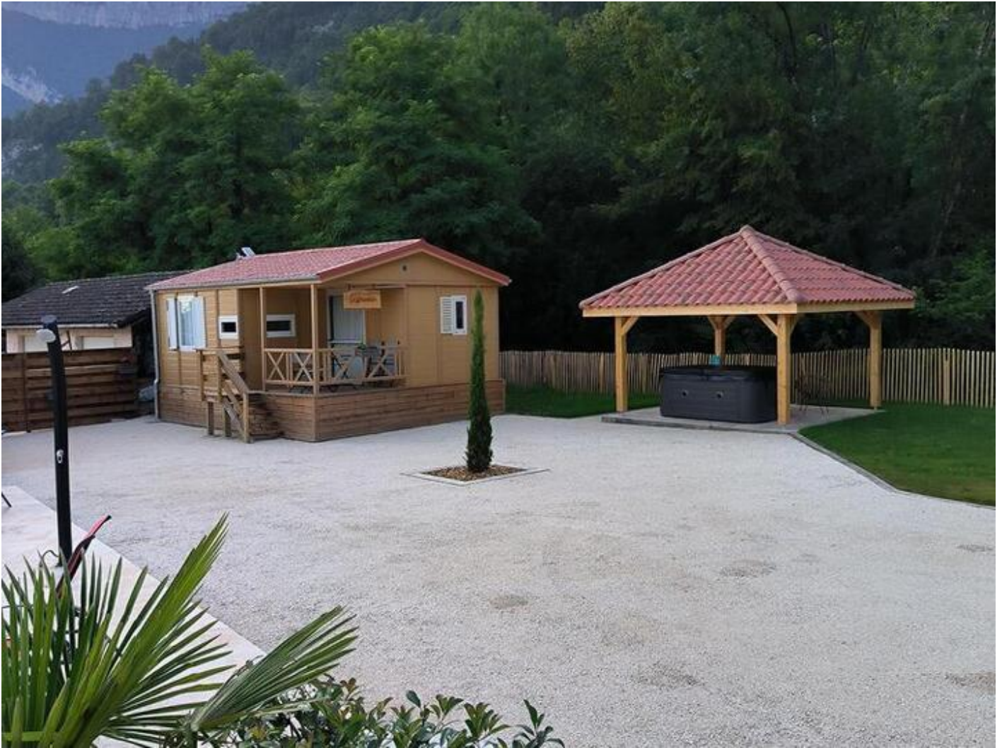
Les Chalets Rovonnais | Le Drevenne 38470 Rovon