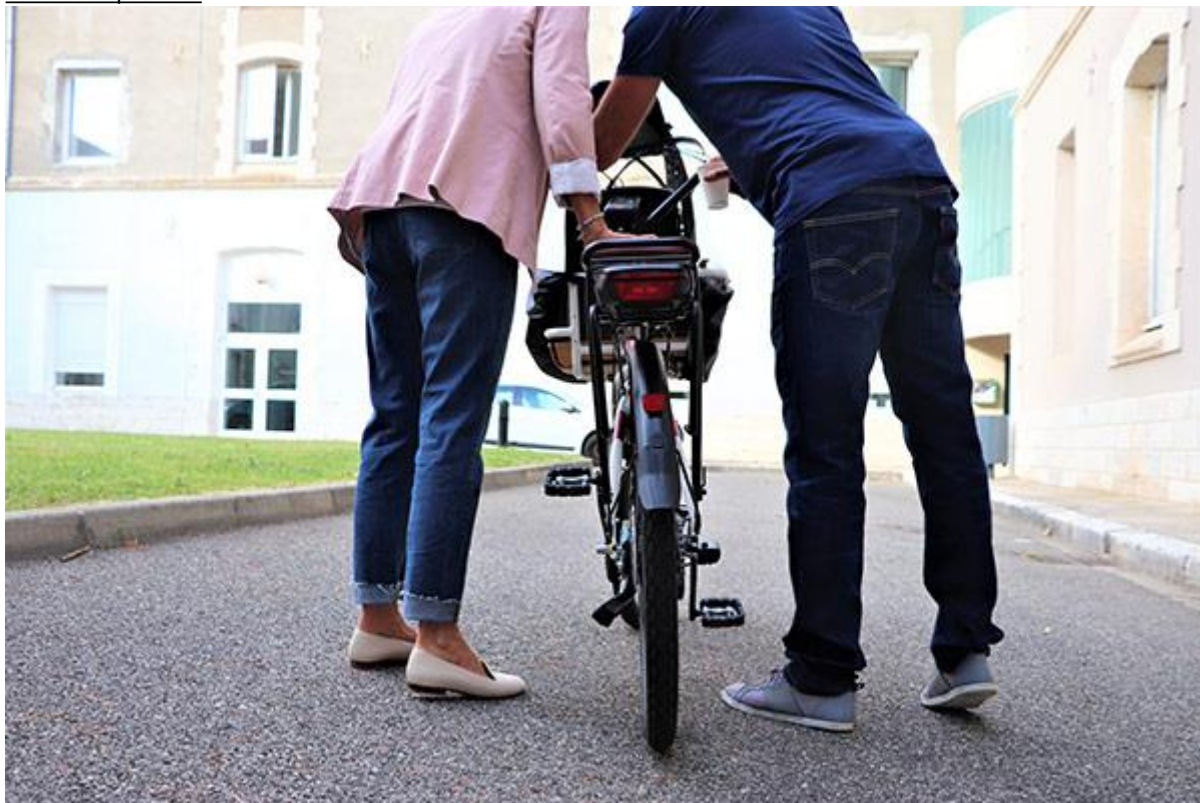
Atelier Saint-Marcellin Mobilité Vélo Pédale douce